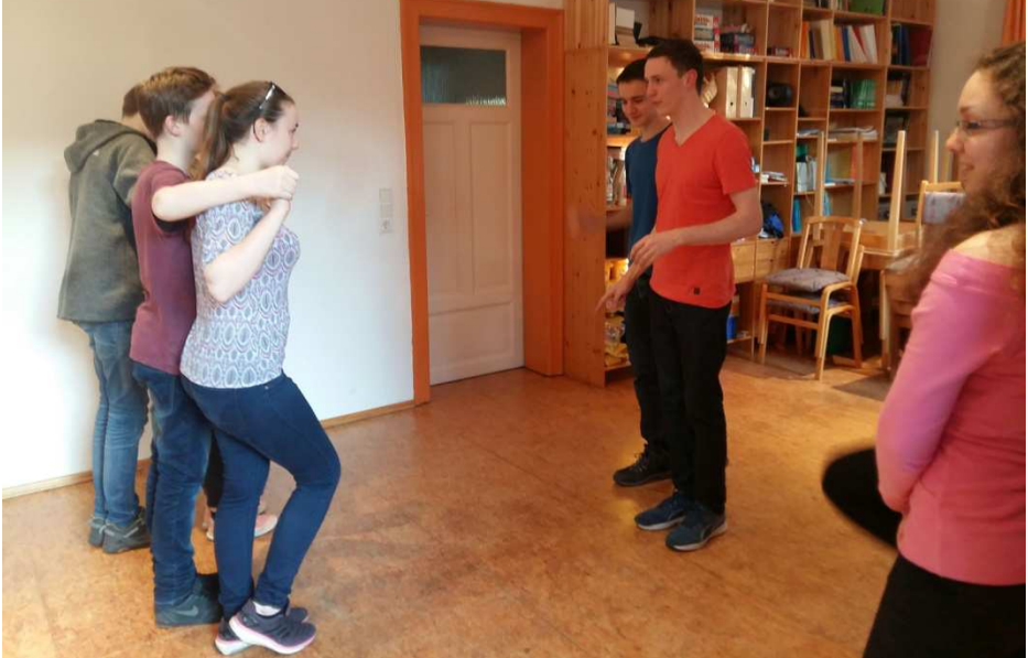
Tanzabend in der JG mit Profi-Anleitung